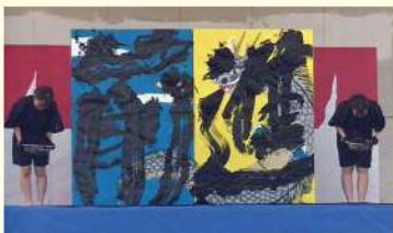
折尾まつりでのパフォーマンス

サツサと動きます。サツサと書きます。練習も短時間集中です。特にパフォーマンス時の動きの速さは、どの学校にも負けません。卒業時には、驚くくらい先を読んで素早く行動する力