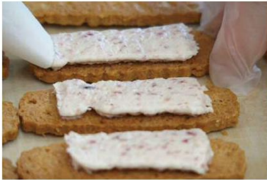
豊かな味わいのクリームにも秘訣が