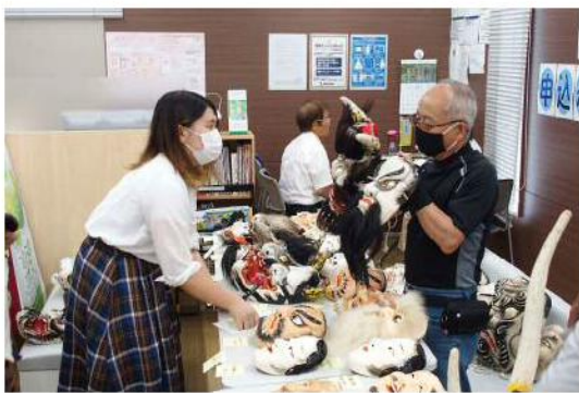
折尾神楽保存会のみなさんに沿革や演目の内容を取材

大鹿 折尾高校書道部による題字をはじめ、デザインと編集には、多くの方に協力をいただきました。折尾神楽の伝統と迫力が伝わるものを目指しました。鐘馗(しやうき)には悪疫退散の意味があるな