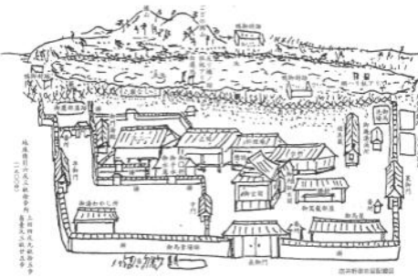
中間市底井野の底井野御茶屋

中間出身の有名な、高倉健（本名小田剛一）氏や、仰木彬氏の名が挙げられるが、高倉健氏の5代先祖の小田宅子氏は女性ばかり十数人で「お伊勢参り」を始めとして日本全国を旅したという記録が残されている。小田家は、底井野で両替商を商つ