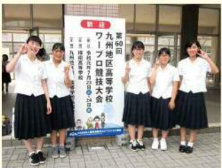
ワープロ競技九州大会会場

それぞれの専門分野を生かした活動も行っています。最近では、「おりこう屋」のGIFアニメーションの作成や本校ホームページの更新、部活動紹介ビデオなども制作しています。