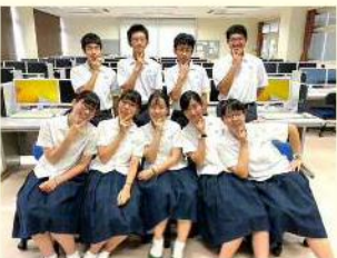
情報処理部 部員集合

部員は、総合ビジネス科・ビジネス情報科の生徒だけでなく、生活デザイン科の生徒も入部しており、タイピング技術だけでなく、商業に関する試験や資格取得の取り組みを行っています。また、学科を超えて、